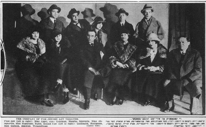
Théâtre d'art yiddish. Cette troupe de théâtre était l'une des nombreuses troupes de théâtre de langue yiddish de New York qui voyageaient à travers l'Amérique du Nord, présentant des productions itinérantes de leurs spectacles. Ces troupes professionnelles apportaient une plus grande qualité de spectacle dans des endroits comme Toronto, où les troupes locales étaient parfois moins bien développées. Le Yiddish Art Theatre s'est produit au Standard à de nombreuses reprises au cours de la première décennie d'existence du théâtre, et également dans d'autres théâtres de Toronto. Il présentait des pièces originales en yiddish ainsi que des interprétations en yiddish ou en russe de William Shakespeare ou de dramaturges européens plus modernes comme Anton Tchekhov (Russe) et Henrik Ibsen (Norvégien). Même après la transformation du Standard en salle de cinéma, ces compagnies se rendaient dans d'autres salles de Toronto pour des représentations spéciales, dans les années 1950.

Tous les membres de la communauté juive de Toronto ont aidé le Standard. Ils ont versé de l'argent pour construire le théâtre. En retour, les billets de spectacle étaient moins chers.