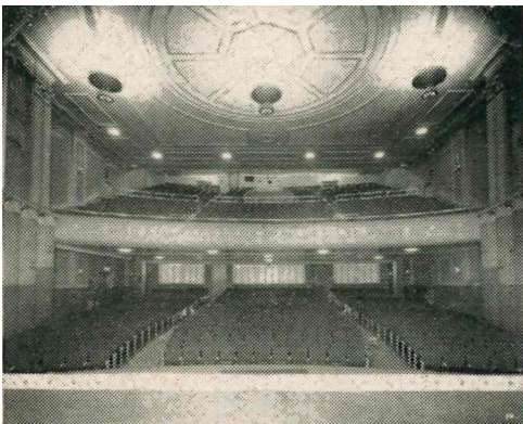
Intérieur du Victory Theatre, Toronto. Jewish Life , avril 1948, p. 17. Archives juives de l'Ontario, MG9