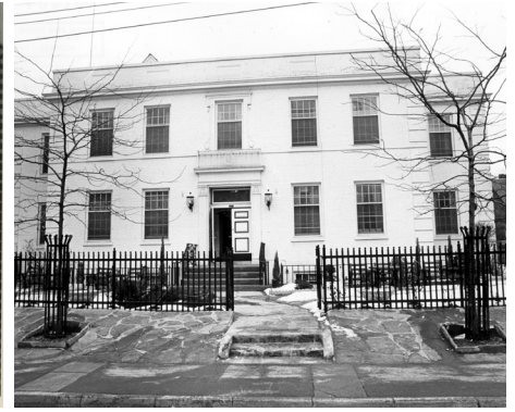
Ancien hôpital Mount-Sinaï, avenue Yorkville, Toronto, [197-]. Le bâtiment d'origine avait été utilisé comme hôpital privé avant que la société Ezras Noshem (Ladies Aid) ne l'achète et ne le rénove pour en faire un hôpital public juif en 1922. Ce bâtiment comptait 20 lits et se concentrait sur les soins aux personnes pendant l'accouchement ou la convalescence à la suite d'une maladie ou d'un accident. Archives juives de l'Ontario, article 1464.